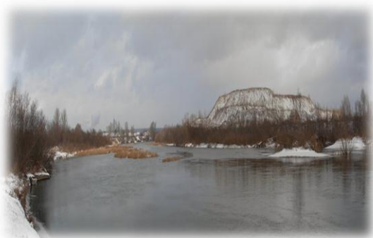
Рисунок 1. Река Бердь