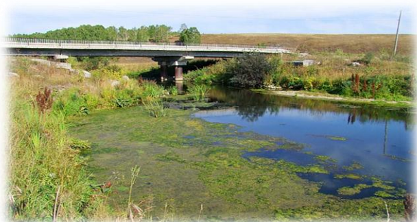
Рисунок 4. Река Шипуниха