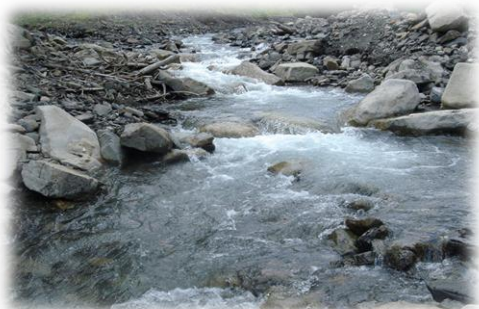
Рисунок 3. Река Каменка