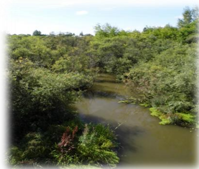
Рисунок 2. Река Чёрная