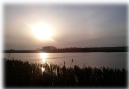
Рисунок 5. Река Койниха