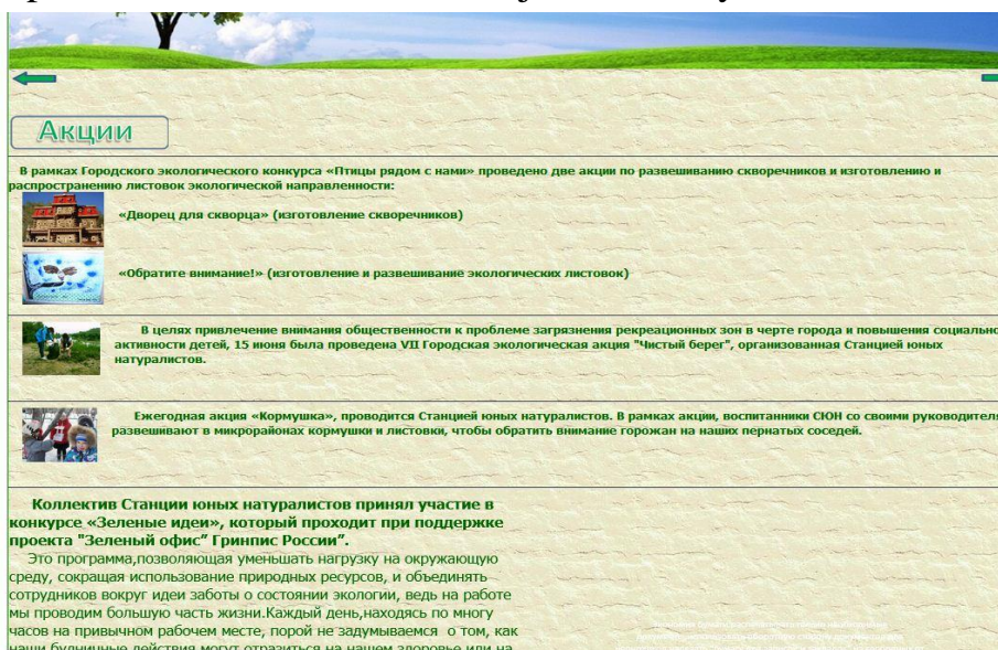
Рисунок 5. Страница акций [Режим доступа: URL: http://cdoisk.ru/index/akcii_sjun/0-221 ]