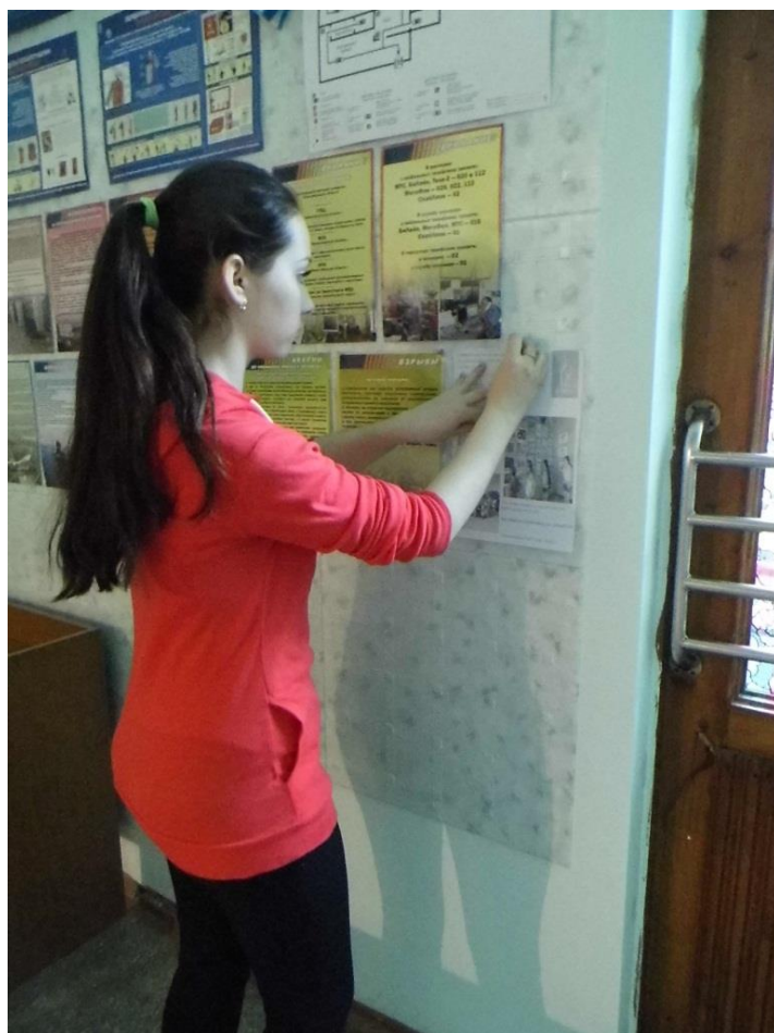
Рисунок 1. Размещение листовки в Центре дополнительного образования г. Искитима.

Также нами были размещены листовки на досках объявлений рядом с остановками общественного транспорта г. Искитима. На рисунке 2 представлен макет листовок, который был размещён на территории города.