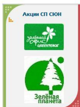
Рисунок 3. Баннер, расположенный с правой стороны сайта

Страницы «Зелёной планеты» входят в сайт МАОУ ДО ЦДО г. Искитима, в эту же систему входит раздел СП СЮН. На страницы можно зайти через баннер, расположенный с правой стороны (рис. 3).