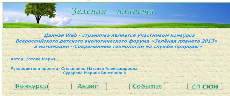
Рисунок 4. Шапка страницы [Режим доступа: URL: http://cdoisk.ucoz.ru/index/sdelaj_mir_zelenym/0-202 ]