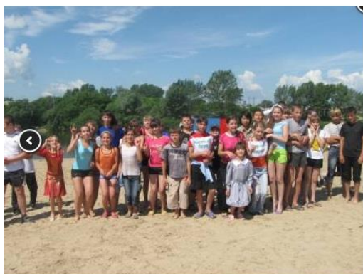
Рисунок 2. Макет листовок

Главная страница сайта: http://cdoisk.ru/